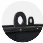
ØYNE FOR LØFTEKRAN

Rubble Truck er en uunnværlig følgesvenn på byggeplassen. Solid utførelse med innebygget tip-funksjon og en kapasitet på hele 400 liter. Påmonterte øyne for løftekran og solide gummihjul gjør den til en allsidig vogn som er med på å opprettholde arbeidsplassen trygg og oversiktlig.